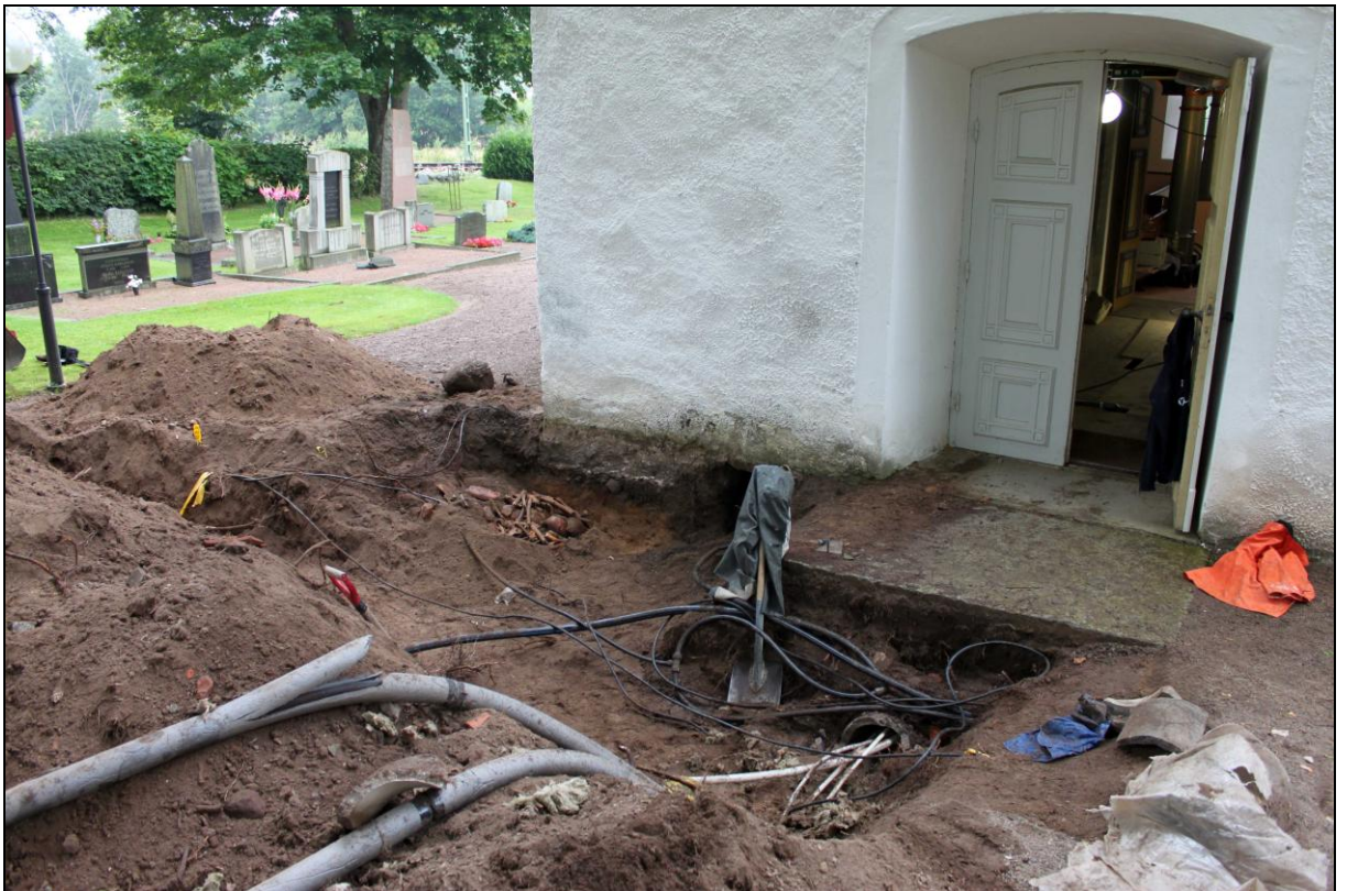
Överblick schaktområdet närmast vapenhuset.