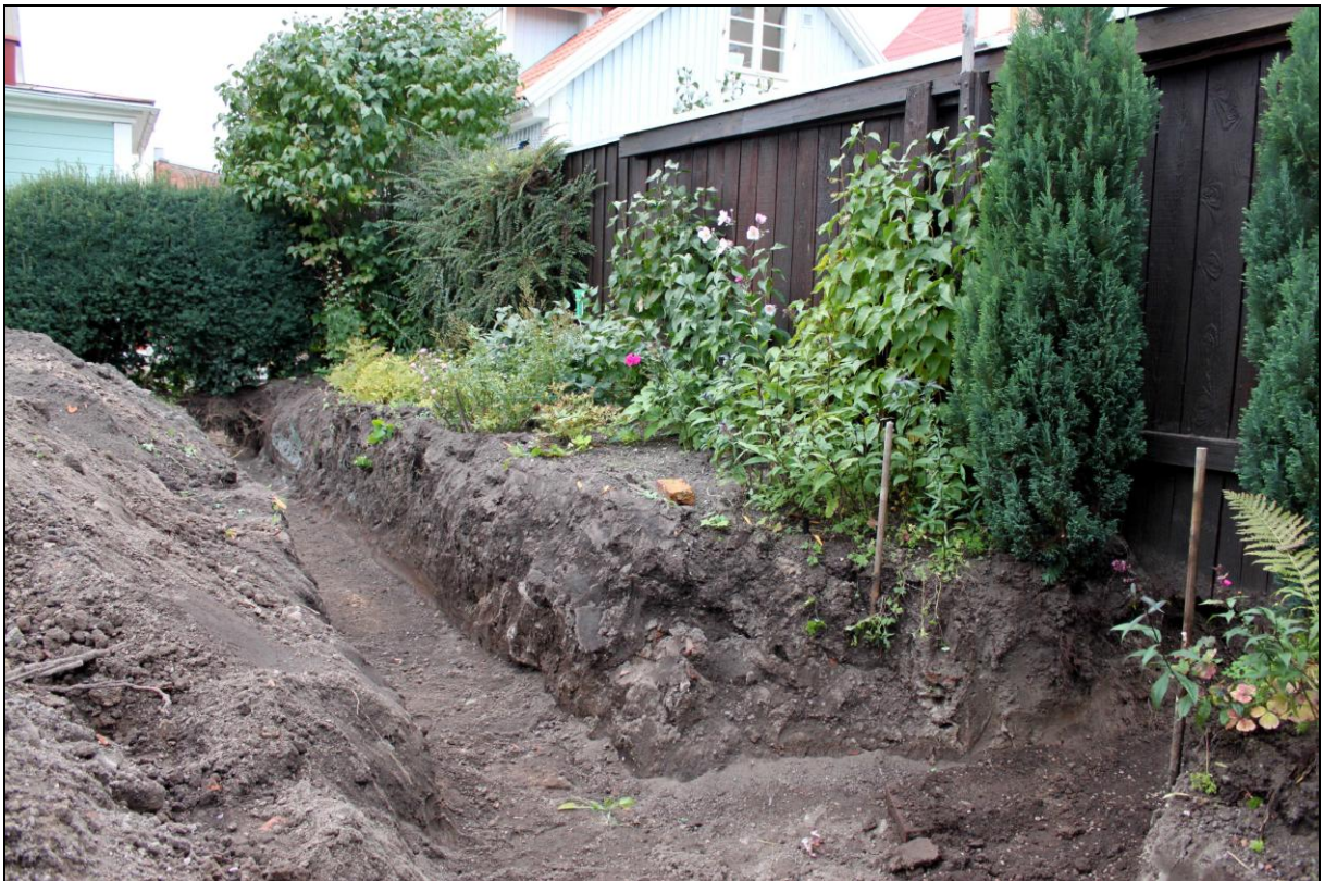
Överblick schakt mot VNV.