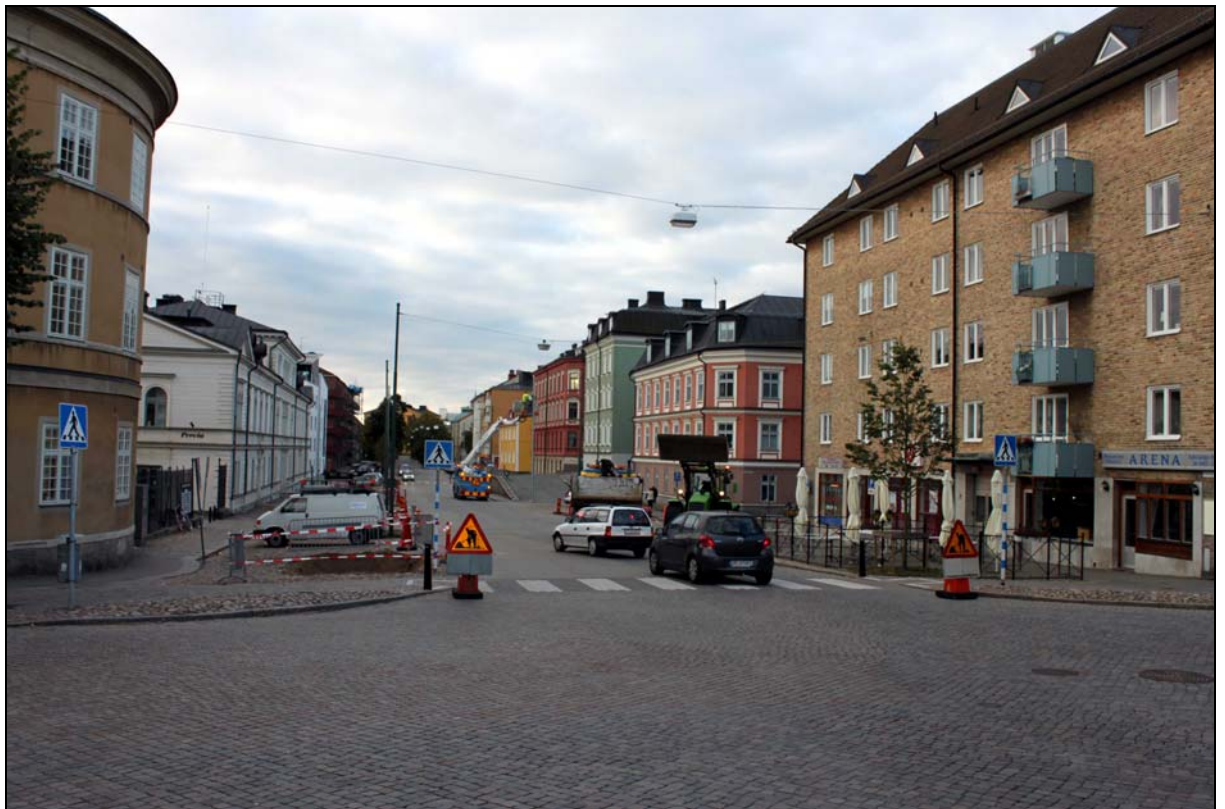
Överblick aktuellt gatuavsnitt mot S