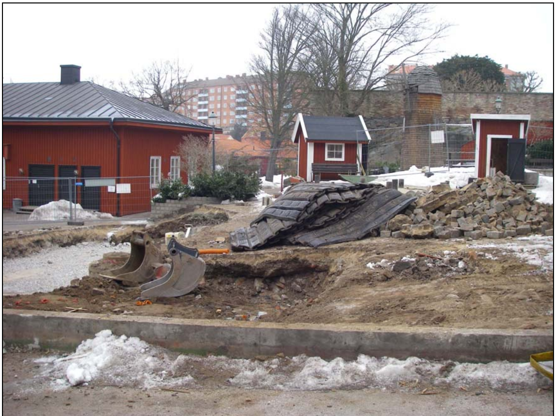
Överblick arbetsområde mot N