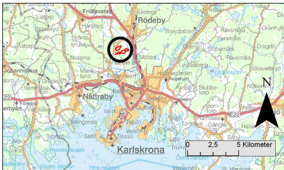
Fig.1 – De ursprungliga planområdenas placering i förhållande till Karlskrona tätort.

Under våren 2008 blev Karlskrona kommuns detaljplan för del av fastigheten Västra Rödeby 3:1 föremål för samråd. Affärsverkens önskan var att i anslutning till Bubbetorpsområdet få tillstånd till ytterligare exploatering för produktion av fjärrvärme och elektricitet samt uppförande av vindkraftverk. Som ett led i det fortsatta planarbetet uppdrog Affärsverken åt Blekinge museum, att vidare utreda planområdenas antikvariska status. Föreliggande avrapportering utgör en redovisning av denna utrednings resultat för bägge, ovan nämnda planområden.