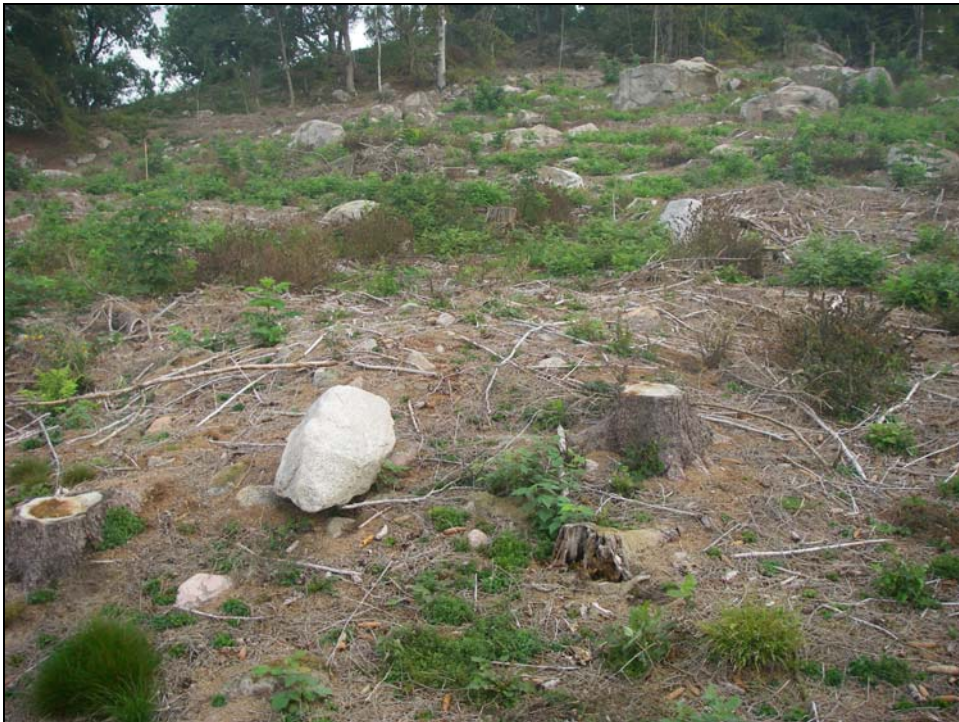
Fig.3 - Flackt odlingsröse inom delområde 2 (nyregistrering 3).

tidstypiska odlingsrösen samt diverse ägo­gränser och hägnadsrester i form av stenmurar. I övrigt påträffades diverse spår av småskalig stenbrytning på olika punkter i terrängen. På fyra platser bedömdes lämningar vara så pass intressanta, att de registrerades i fornlämningsregistret. Det rör sig här om tre exempel på fossil åker (bilaga 1 nr.2-4), av betydligt äldre utseende än de i övrigt påträffade inom planområdet, samt ett par s.k. halvågar (bilaga 1 nr.1). Terrängen kan överlag sägas vara tämligen oländig, och det är generellt mindre sannolikt, att förhistoriska boplatsspår i någon större utsträckning påträffas vid förestående markarbeten.