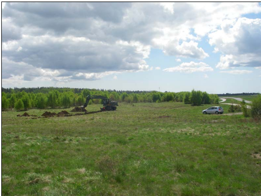
Del av UO mot S.