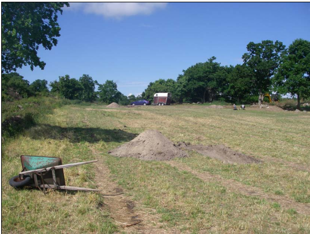
Utredningsområdet fotograferat mot V.