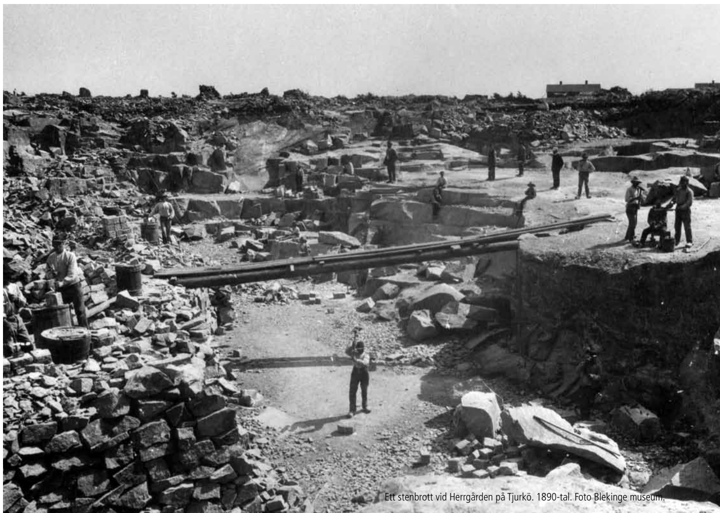
Ett stenbrott vid Herrgården på Tjurkö. 1890-tal.

Genom området löper en markerad vandringsled som passerar flera anläggningar och minnesmärken från stenhuggeriets tid. Hela slingan är cirka 1,5 km lång och utmärkt med punkter på kartan. Ta med foldern och gör en rundvandring! OBS! Stigen är ej tillgänglighetsanpassad.